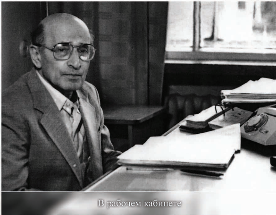
В рабочем кабинете