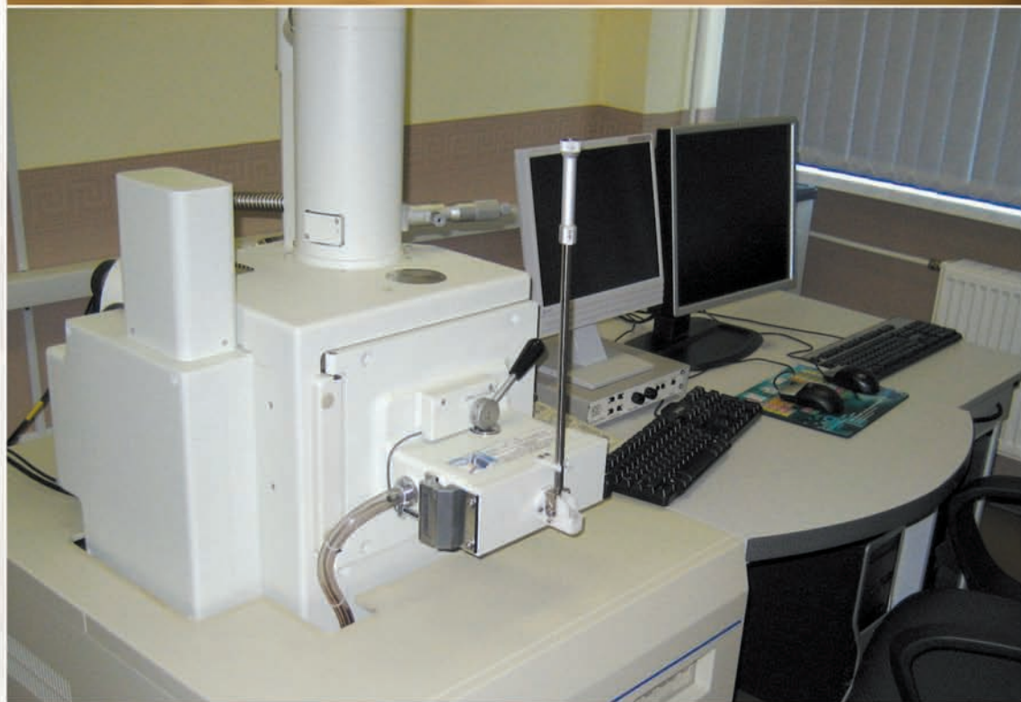
Растровый электронный микроскоп JSM-6490LV фирмы Jeol для анализа структуры материалов на металлической и неметаллической основах