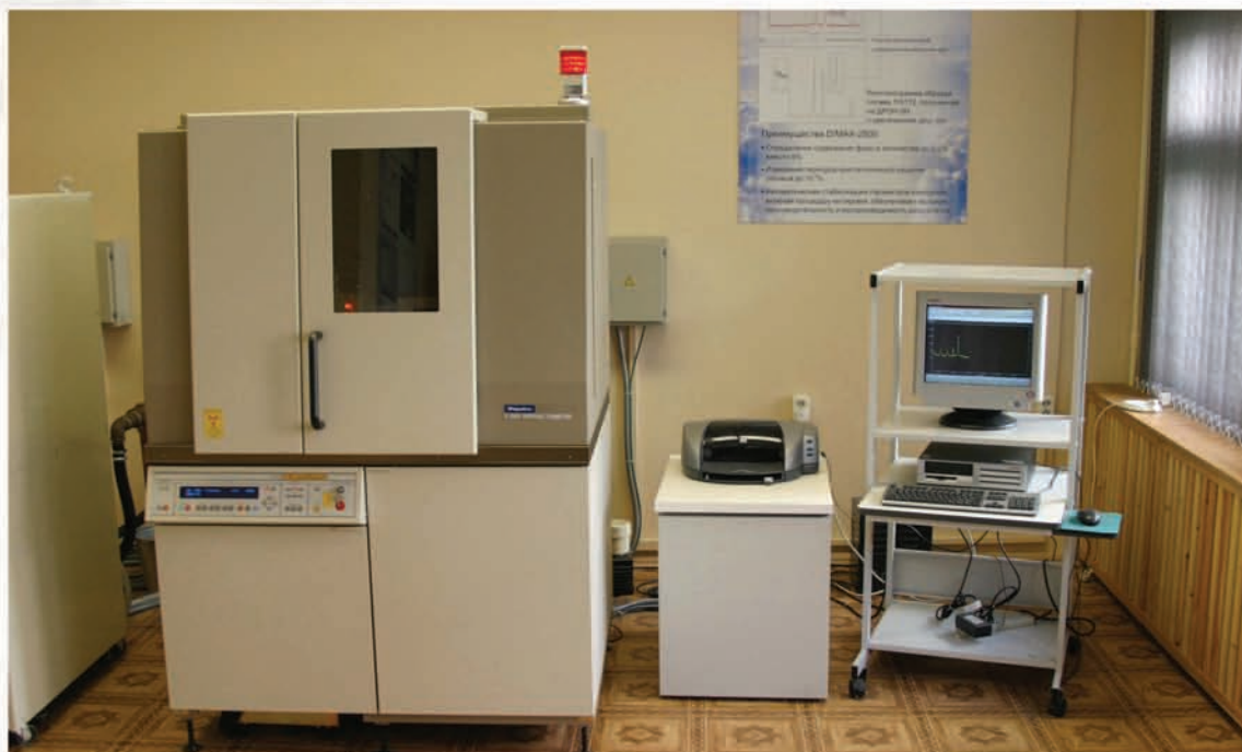
Сверхмощный дифрактометр D/MAX-2500 фирмы Rigaku для рентгеноструктурных исследований