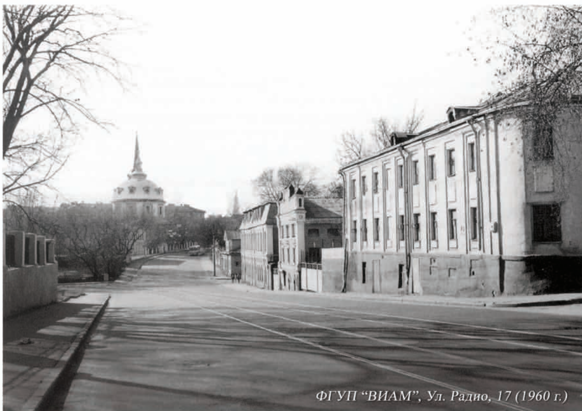
ФГУП «ВИАМ», Ул. Радио, 17 (1960 г.)