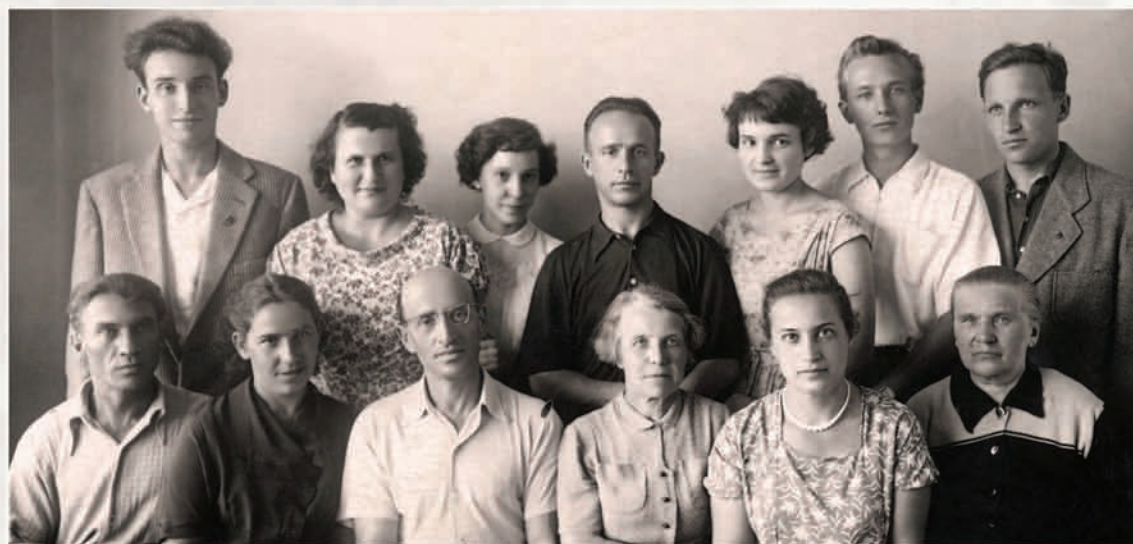
Коллектив сектора радиоизотопных исследований (1957 г.)

Группа занималась разработкой промышленной технологии термовакуумной обработки никелевых и алюминиевых жаропрочных сплавов, а также исследованием поведения материалов в условиях глубокого вакуума. Группой был создан способ восстановления работоспособности материала турбинных лопаток с помощью термовакуумной обработки, который применяется на заводах и сегодня при ремонте – для увеличения эксплуатационного ресурса в 1,5–2 раза.