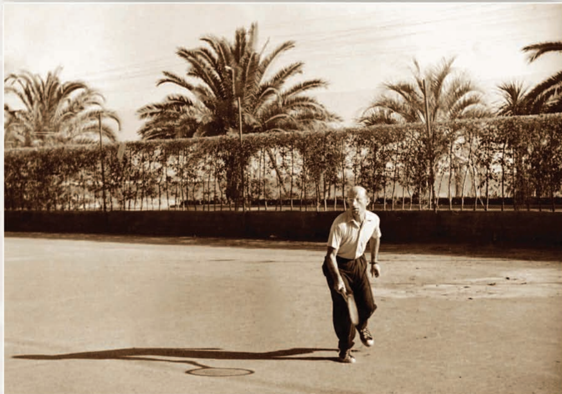
На теннисном корте (1950 г.)